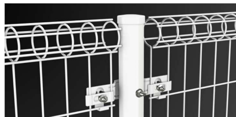
【パネル設置イメージ】